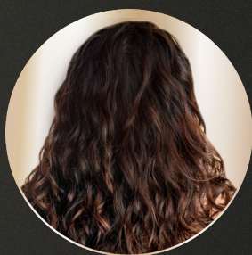
МЯГКИЕ НЕЖНЫЕ ВОЛНЫ